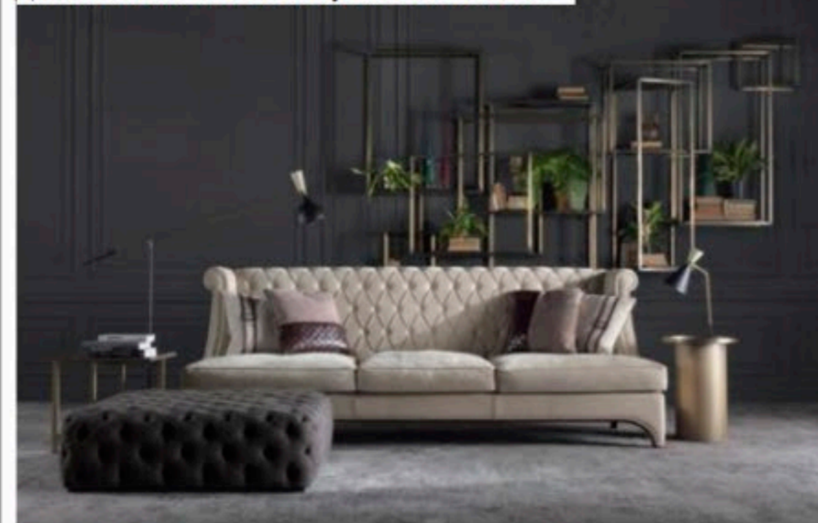
Диван BRADMORE ок Gianfranco Ferré Home

“La capacità creativa del nostro gruppo attraversa in modo trasversale periodi storici, culture e mondi differenti. Lo spirito creativo che ci guida attualmente ci porta verso linee più contemporanee e pulite in termini formali”