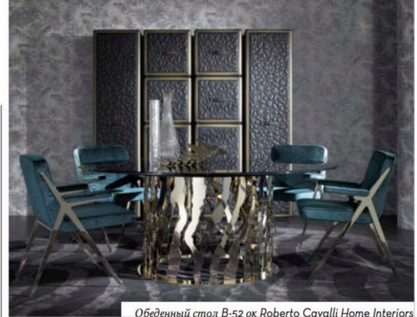
Обеденный стол B-52 ок Roberto Cavalli Home Interiors

Lavorare per fashion brand celebri come Cavalli, Ferré ed Etro è un onore ma anche una sfida complessa: significa interagire con creativi provenienti da settore diversi e di conseguenza con approcci creativi diversificati. Diventa pertanto necessario aprire la propria